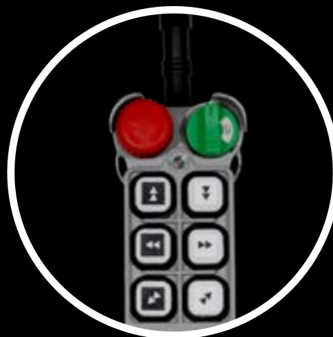
RADIOCOMANDO TELECRANE ITALIA (fornito di serie)

Il kit SWF BlackLine prevede l'alimentazione del paranco con catena portacavo originale SWF Energy Chain in luogo del festone; gru innovativa e sicura senza cavi a vista.