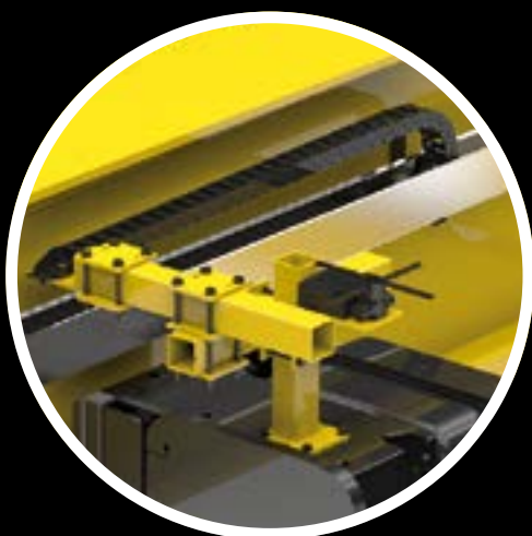
SWF ENERGY CHAIN (fornita di serie)

Componentistica di eccezionale qualità progettata esplicitamente per queste applicazioni garantisce la migliore affidabilità e durata del tempo.